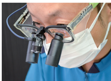
精度の高い治療を行うために使用する高倍率ルーペ

また、帰宅時間が遅く、仕事が忙しいなどの理由で、歯医者に通いたくても通えない人のために水・日曜以外午後8時まで、土・日曜の診察もしているのも注目したい点。子どもの虫歯治療や予防のためのフッ素塗布なども行うなど、地域のホームドクターを目指し、一人一人に寄り添った治療を行っています。「失った歯は二度と